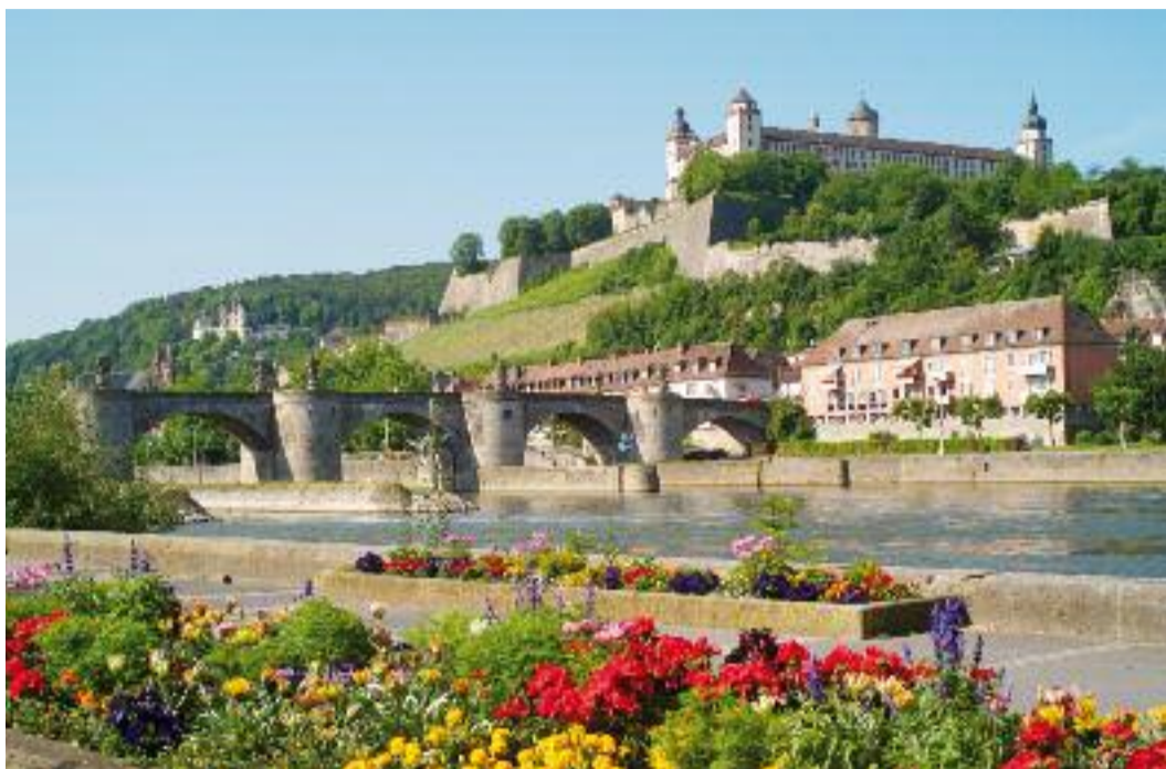
■ Blick auf die Festung Marienberg in Würzburg.

Auch in diesem Jahr geht Bornheim wieder für einen Tag lang auf Reisen. Ziel der Busfahrt anno 2011: die Bischofsresidenz Würzburg. Am Samstag, 15. Oktober 2011, 7.00 Uhr geht es mit mehreren Bussen los in Richtung Bayern. Der Reisepreis beträgt pro Person 39 €, worin eine Stadtführung durch Würzburg enthalten ist. Eine Anmeldung ist unbedingt rechtzeitig beim Reisebüro Lais im EDEKA-Center Bornheim (Tel. 02222 - 1031) erforderlich. Nach Reisen in den vergangenen Jahren, wie zum Beispiel nach Münster, Heidelberg, Luxemburg und Metz geht es nun nach Würzburg. Die Stadt ist eine geglückte Synthese aus Landschaft, Wein und Barockhäusern. Schon von weitem wird der Gast von der Festung Marienberg, dem Wahrzeichen der Stadt begrüßt. In der City aber auch im Dom finden