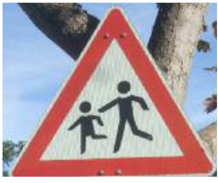
■ Vorsicht! Kinder!