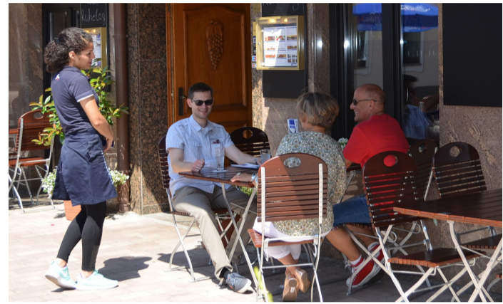
■ Ein Zeichen der gestiegenen Attraktivität: Viele Gewerbetreibende nutzen die großzügigen Bürgersteig-Flächen bereits für Außengastronomie.

Im Ortszentrum werden derzeit Sitzbänke und Blumenkübel aufgestellt, Fahrradständer installiert sowie Abfallbehälter angebracht. Zur Sicherung des Fußgängerbereichs werden im Verlauf des einbahnigen Abschnitts der Königstraße und im Bereich des Peter-Fryns-Platzes Poller montiert. Weitere Poller ersetzen zukünftig die Anfahrtschwellen vor der gegenüberliegenden Bäckerei. Daneben wird ein Kunstwerk des Bornheimer Steinmetzes und Steinbildhauers Helmut Sistig die Königstraße zieren. Bis Ende August soll auch die Umgestaltung des Peter-Fryns-Platzes weitgehend abgeschlossen sein. Lediglich eine kleine Fläche von drei bis vier Metern entlang der Polizeiwache und der Regionalfiliale Bornheim der Kreissparkasse Köln wird noch nicht bepflanzt, da beide Gebäude noch modernisiert werden. Bis auf diesen kleinen Abschnitt steht der Peter-Fryns-Platz sowohl für das Bornheimer Gewerbefest als auch für die Bornheimer Kirmes am ersten September-Wochenende und natürlich auch danach für alle geplanten Aktivitäten zur Verfügung. Da an verschiedenen Stellen Stromanschlüsse und ein Wasseran-