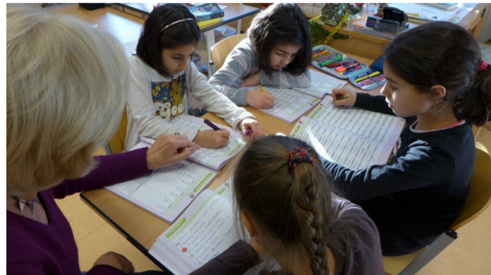
Das gemeinsame Arbeiten macht beiden Seiten Spaß.

„Sprache ist der Schlüssel zum schulischen Erfolg“, sagt Bürgermeister Wolfgang Henseler. „Daher danke ich neben allen Beteiligten auch ausdrücklich der Bornheimer Bürgerstiftung und dem Rotary-Club Bornheim, die als Sponsoren maßgeblichen Anteil an der Realisierung haben.“ Vom Sprachpaten-Projekt profitieren beide Seiten: Während die Schulkinder zusätzliche Aufmerksamkeit und Förderung erfahren, können die Paten den Umgang mit Kindern pflegen und haben die Gewissheit, gebraucht zu werden.