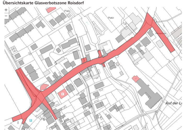
Anlage 3 zur ordnungsbehördlichen Verordnung der Stadt Bornheim über die Geltung eines Glasverbotes anlässlich der Karnevalsumzüge an „Weiberfastnacht“ und am „Karnevalssamstag“ im Bereich der Ortschaften Kardorf, Roisdorf und Waldorf vom 01.02.2018