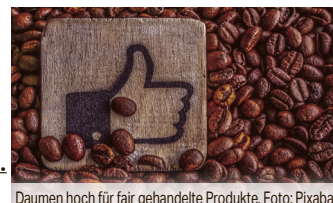
Daumen hoch für fair gehandelte Produkte.

> Weitere Infos und Videos unter: www.bornheim.de/fairtrade