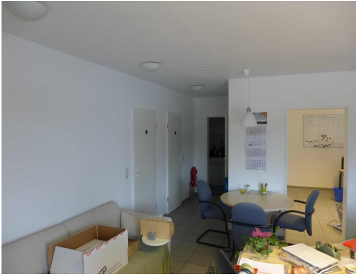
Büro im Eingangsbereich