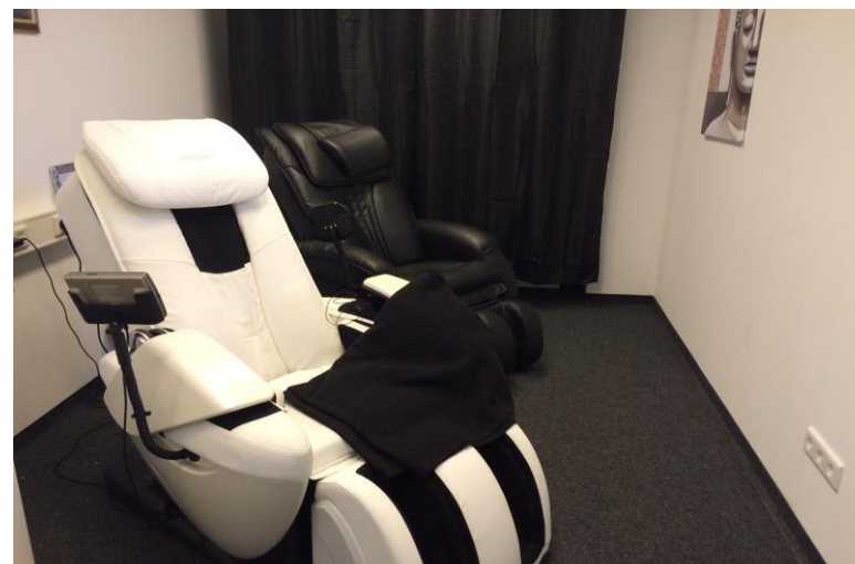
Entspannungsraum mit Apple TV