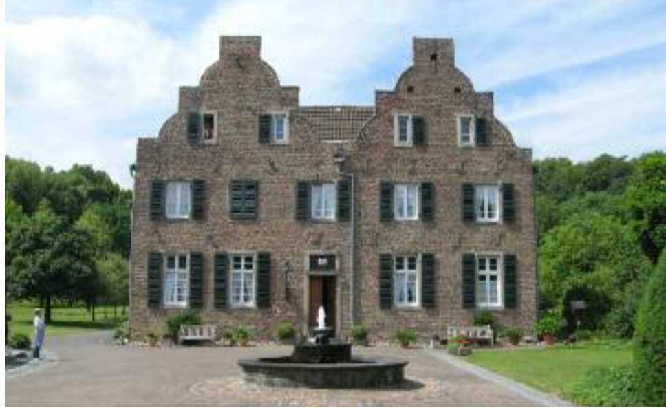
■ Auch die Wolfsburg ist am Tag des offenen Denkmals zu besichtigen.