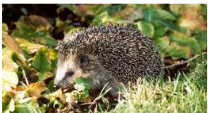
■ Igel auf Nahrungssuche

Mit dem abnehmenden Tageslicht und kühleren Temperaturen sind die Igel wieder auf der Suche nach einem geschützten Quartier für den Winterschlaf, den sie spätestens im November antreten. Ihr laubgepolstertes Winternest richten sie gerne in Komposthaufen ein, die mit Reisig und Schnittresten gespickt sind, oder unter einem Holzhaufen. In liegen gelassenem Laub können sie nach Insekten und Schnecken stöbern. Daher sollte der herbstliche Gartenputz nicht zu gründlich ausfallen. Gut gemeinte Versuche, den stacheligen Vierbeinern im Haus über den Winter zu helfen, können ohne das nötige Wissen über artgerechte Pflege schlimme Folgen haben. So verbrauchen Igel im Winterschlaf schon in Räumen mit mehr als 6°C zuviel Energie und werden geschwächt. Mit dem Einrichten einer Futterstelle kann man jetzt jungen Igeln vor dem Winterschlaf helfen, ohne sie ins Haus zu holen. Ein abendliches Schälchen Katzenfutter hilft, die kleinen Bäuche zu füllen, so dass auch im Spätsommer geborene Igel noch tüchtig zulegen können. Mit etwa 500 Gramm Körpergewicht Anfang November hat ein Jungtier eine gute Chance, den ersten Winterschlaf aus eigener Kraft zu überstehen. Verletzte, kranke und hilflose Igel dürfen ins Haus geholt werden, um sie gesund zu pflegen. Hilfsbedürftige Igel erkennt man daran, dass sie tagaktiv sind, herumliegen oder torkeln. Kein gesundes Stacheltier geht am Tage auf Nahrungssuche, es sei denn, es wurde aufgescheucht. Schwache Igel sind zudem oft mager und fühlen sich kälter