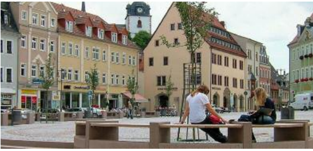
■ Blick auf den schönen Marktplatz von Mittweida

Aus einer fast zufälligen Kontaktaufnahme wurde 1991 eine Städtepartnerschaft zwischen dem sächsischen Mittweida und unserer Heimatstadt Bornheim. Auf breiter Ebene wird diese Verbindung auch heute noch aktiv gepflegt. Doch was hat sich in den zwei Jahrzehnten in unserer Partnerstadt getan? Wie hat sich Mittweida unter den nicht immer leichten Bedingungen seit der Wiedervereinigung entwickelt?