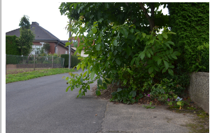
■ Überwuchs kann zu Ärger führen.

Es kommt immer wieder vor, dass an Kreuzungen, Einmündungen sowie Fuß- und Radwegen Behinderungen durch überhängende Äste und zu breit oder zu hoch wachsende Hecken bestehen. Auch Straßenlampen und Verkehrszeichen sind oft durch privates Grün zugewachsen. Sowohl die Verkehrssicherheit als auch die Orientierung aller Verkehrsteilnehmer wird dadurch beeinträchtigt.