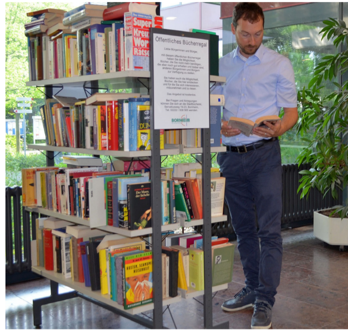
Ein Eldorado für Leseratten: die öffentlichen Bücherregale im Rathaus-Foyer.

Fragen und Anregungen nimmt die Bornheimer Stadtbücherei unter der Telefonnummer 02222/938-565 gern entgegen.