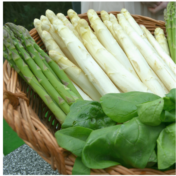
■ Ein Markenzeichen der Stadt ist der Bornheimer Spargel, der seit 2014 den gleichen Patentschutz wie Parmaschinken und Parmasankäse genießt.

Das Bürgerforum für die Rheinorte Hersel, Widdig und Uedorf hat bereits erfolgreich stattgefunden. Nun folgt das Forum für das südliche Bornheim mit den Ortschaften Bornheim, Brenig, Roisdorf und Dersdorf am Donnerstag, 25. August 2016, um 19 Uhr in der Kaiserhalle, Königstraße 58, 53332 Bornheim. Den Abschluss bildet dann das Bürgerforum für das nördliche Bornheim mit den Ortschaften Sechtem, Merten, Waldorf, Hemmerich, Walberberg, Kardorf und Rösberg am Dienstag, 13. September 2016, um 19 Uhr in der Gaststätte Vorgebirgsblick, Händelstraße 45, 53332 Bornheim-Merten.