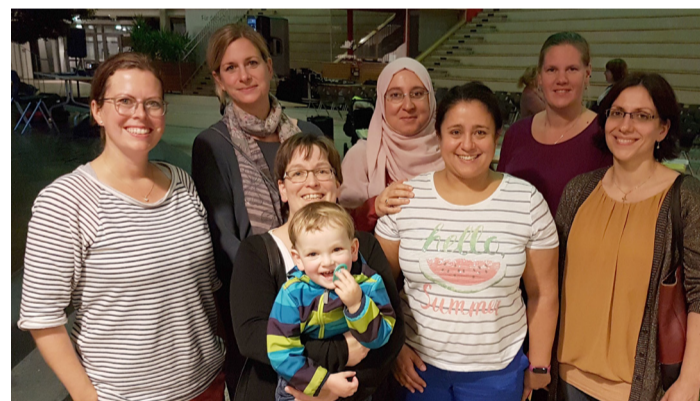
Die Mitglieder des Jugendamtseleternbeirats freuen sich auf ihre neue Aufgabe.

beiräte aller Bornheimer Kitas in freier und städtischer Trägerschaft. Das Gremium vertritt die Eltern-Interessen gegenüber den Trägern und dem Jugendamt. Dabei widmen sich die Mitglieder Themen wie der Erhebung von Elternbeiträgen, der Mittagsverpflegung in den Kitas und den Schließungszeiten in den Sommerferien. Der JAEB steht in regelmäßigem Austausch mit dem Jugendamt, um aktuelle Inhalte zu besprechen. Der Jugendamtseleternbeirat verfügt im Jugendhilfeausschuss über einen Sitz mit beratender Stimme. Darüber hinaus nimmt das Gremium an der Zukunftswerkstatt teil, einer Klausurtagung zur Weiterentwicklung der Bornheimer Bildungslandschaft.